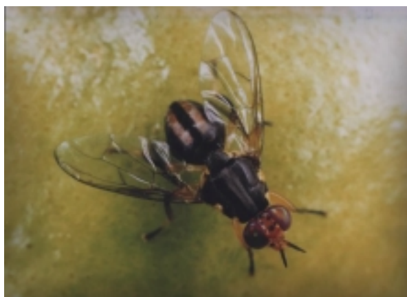
Figure 1. Bactrocera kirki .

Les mouches des fruits (Diptères: Tephritidés) (Figures 1-4) sont des insectes nuisibles dont les larves, appelées asticots, infestent et se nourrissent de la chair des fruits et légumes charnus (Solanacés et Cucurbitacés). Elles causent des dégâts considérables et limitent les possibilités d'exporter fruits et légumes. Il existe huit espèces de mouches des fruits en Polynésie française et aux Îles Pitcairn. Quatre d'entre elles sont des espèces introduites nuisibles aux fruits cultivés. Les quatre autres espèces sont indigènes et endémiques et sont sans importance économique. On peut échantillonner les mouches des fruits en installant des pièges appâtés de substances chimiques qui attirent les mouches mâles (Cue-lure ou méthyl eugénol). On peut également récolter des fruits soupçonnés d'être infestés et les incuber pendant deux semaines sur de la sciure de bois.