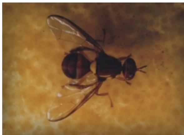
Figure 2. Mouche des fruits du Queensland ( B. tryoni ).