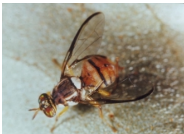
Figure 3. Mouche orientale des fruits ( B. dorsalis ).