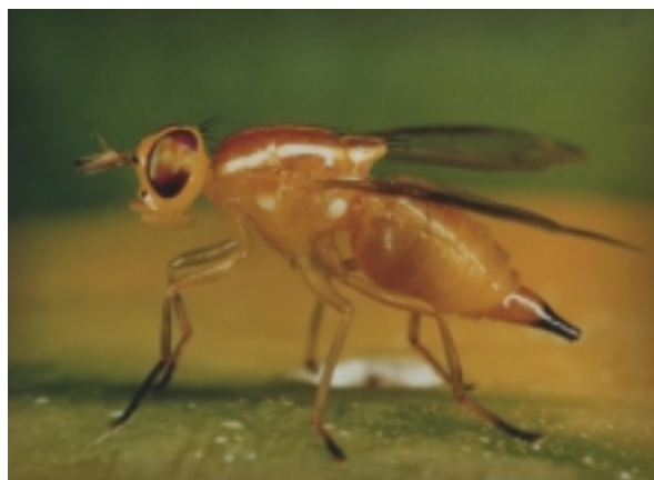
Figure 4. Mouche des fruits du Pacifique ( B. xanthodes ).